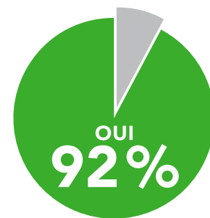
Êtes-vous en confiance suite à l'intervention ?